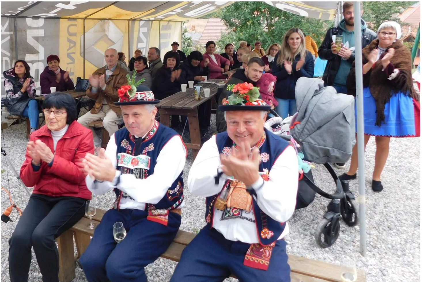
Fotografie pořízená u příležitosti 10 let MS v areálu muzea