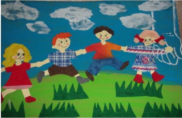
Obrázek vytvořený dětmi v Pampeliškách byl vystaven při slavnostní bohoslužbě ke státnímu svátku v přímém přenosu ČT 28. 10. 2022

Všechny aktivity jsou pro děti zdarma. Napříč všemi „Pampeliškovskými“ skupinkami se děti společně setkávají při oblíbených společných akcích, jako je Mikulášská besídka, Tříkrálová sbírka, Velikonoční obchůzka s řehtačkami, přespávačka na ukončení školního roku a letní tábor, který je v plánu i tento rok.