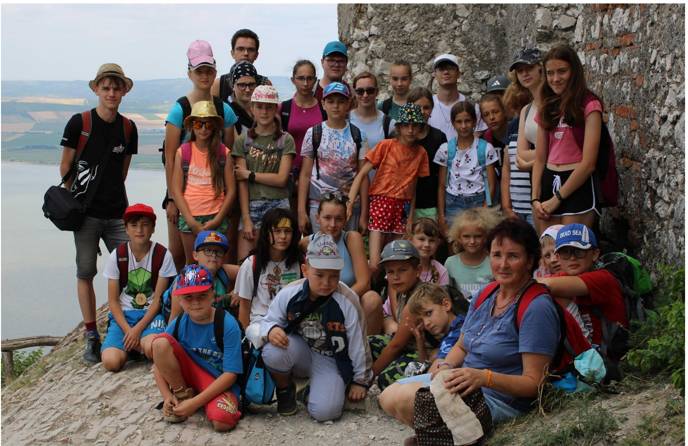
Táborové foto na Děvině